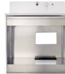
写真は開きタイプです。

いつまでも美しい輝きを放つ、ステンレスキャビネットを標準装備。お手入れもカンタン。