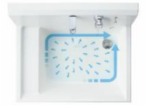
写真は間口75cmのボールです。