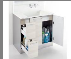
引出しタイプ(スタンダードレール)

小分けができる引出しと、収納スペースの広い開き扉の組み合わせで、効率よく収納できます。