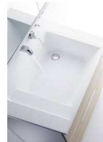
写真は間口90cmのボールです。

ボール周囲の「流レール」が髪の毛や泡を集めて排水口へ導きます。さらに中央を高くするという逆転の発想で「流レール」へ水の流れをつくります。