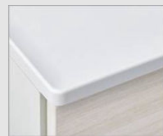
F ブレンネオホワイト(マット)