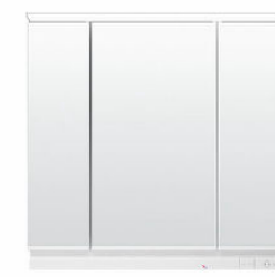
LEDライン照明・3面鏡・全収納 MRA-903TXEU

間口900mm コンセント3個 家電から小物まで 使いやすいしまえるミラーキャビネット 深型トレイ 仕切りトレイ コーナー コンセント くもり止めLED